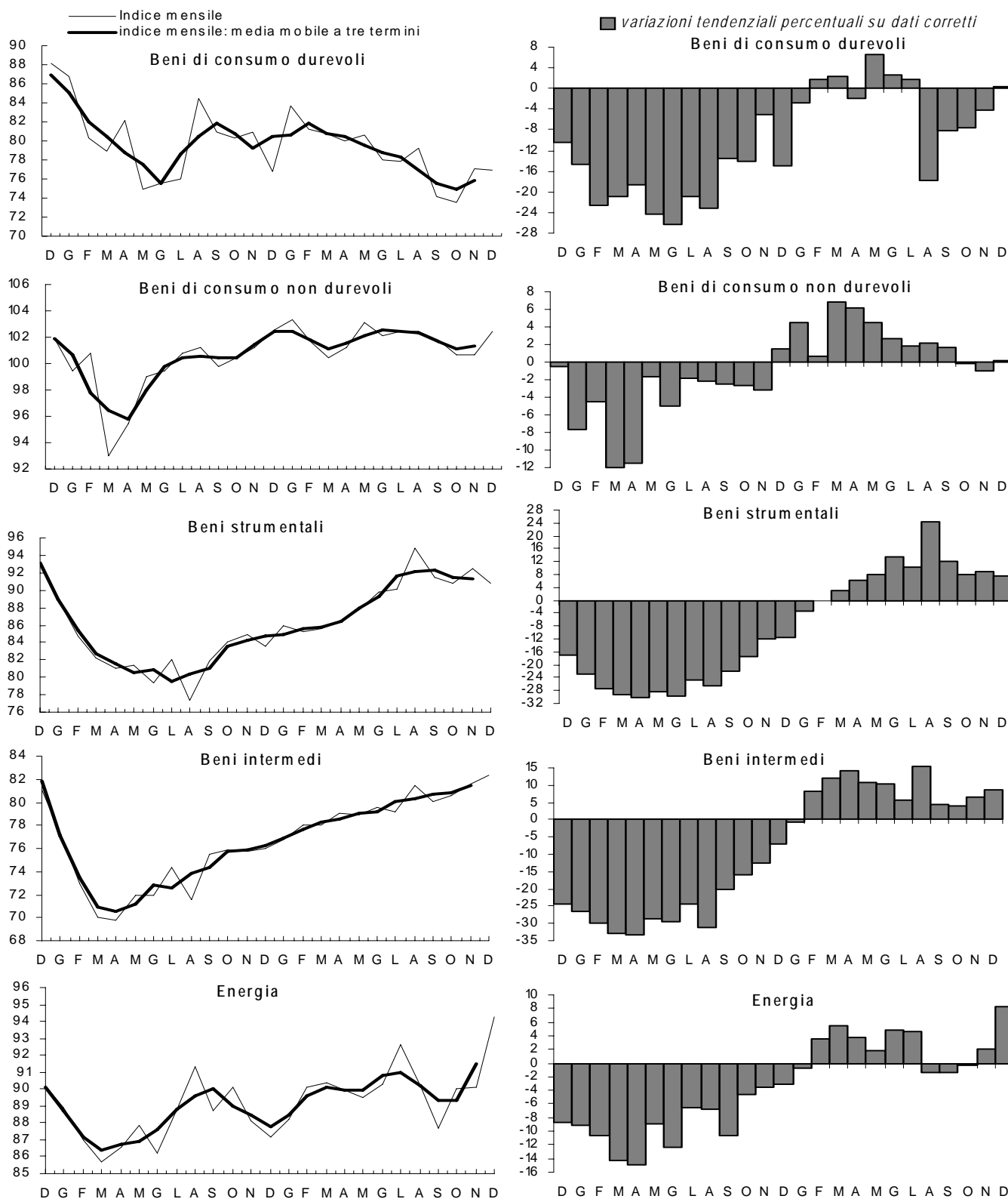
Quadro 1. Raggruppamenti principali di industrie: indici destagionalizzati e variazioni tendenziali percentuali su dati corretti per gli effetti di calendario. Dicembre 2008-Dicembre 2010